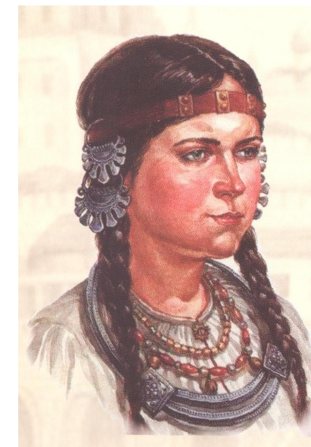
Девушка из племени вятичей, X в.

VIII–IX вв. – на берегах рек Оки, Москвы, Клязьмы поселилось славянское племя вятичей. Для одной из своих стоянок избрали они высокий холм на берегу Москвы-реки, там, где в неё впадают воды Неглинной. Холм был покрыт лесом, на сухом песчаном взгорье росли высокие и крепкие боровые сосны. На мысу поставили укреплённый город. Сейчас его никто так не назвал бы, но по тогдашним понятиям это был настоящий город.