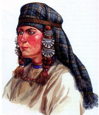
Замужняя женщина из племени вятичей, X в.

Расположение в месте пересечения водных и сухопутных путей было очень выгодным и способствовало процветанию города. Правда, сухопутное передвижение в те времена было затруднено, поскольку дорога шла через глухой лес. И, как следствие, в нём изобиливали хищники и могли встретиться «лихие люди». Тогда как по рекам можно было перемещаться без каких-либо затруднений.